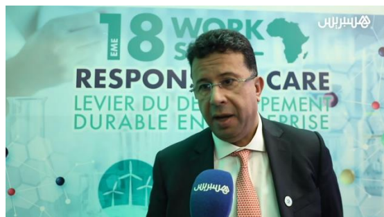
Reportage HESPRESS en Arabe